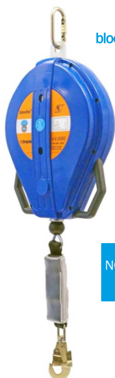
blocfor™ 30 ESD 150KG

Le Blocfor™ 30 ESD 150kg, antichute à rappel automatique, a été équipé du nouveau système ESD (End System Dissipator) Le système ESD assure à l'utilisateur un impact inférieur à 600 daN même si ce dernier chute lorsque le câble est complètement déroulé. Le système ESD permet de réduire la violence de l'impact sur le corps de l'utilisateur en cas de chute et protège efficacement l'extrémité du câble des risques de coupure infligée par les angles vifs des toitures terrasse.